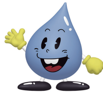
東京都水道局キャラクター 水滴くん