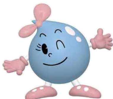
東京都水道局キャラクター 水玉ちゃん