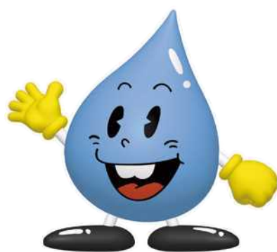
東京都水道局キャラクター 水滴くん