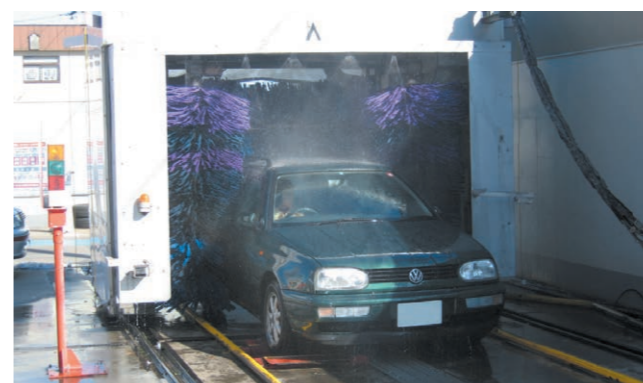
▲ガソリンスタンド