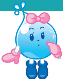
東京都水道局 マスコットキャラクター「水玉ちゃん」