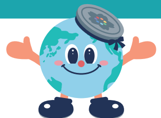
東京都下水道局 マスコットキャラクター 「アースくん」