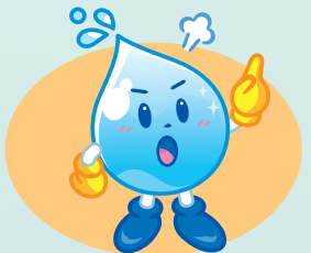
東京都水道局 マスコットキャラクター「水滴くん」

浄水器などの販売 排水管の点検・清掃・修理 水道料金などの集金 口座情報の聞き出し