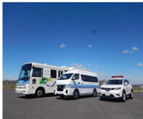
水質試験車・緊急自動車