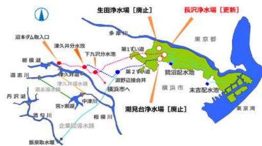
水源と浄水場の位置

この経験を通じて得た多くのノウハウを提供することによって、給水人口や給水量が減少した状況においても、健全かつ安定的な事業運営ができるよう支援いたします。