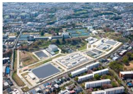
再構築後の長沢浄水場