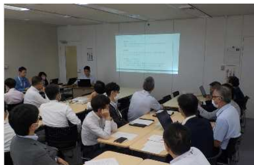
実行責任者向け研修(教育)