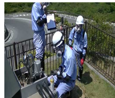
受注者による大涌谷火山活動対応時の様子