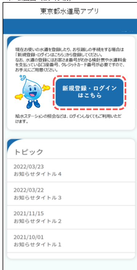
ホーム画面（ログイン前）

アプリインストール時に追加されたアイコンをタップし、アプリを起動します。 起動するとホーム画面（ログイン前）が表示されます。