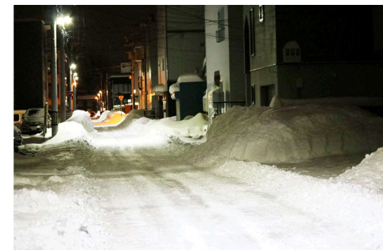
札幌市内の積雪状況

積雪寒冷地である本市の現場作業においては、管路やバルブの位置を探し出すことが困難な状況があります。管路やバルブの位置を容易に把握することができれば、作業の大幅な時間短縮を期待できます。