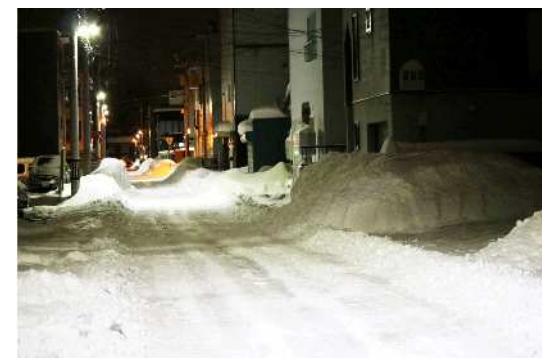
札幌市内の積雪状況

積雪寒冷地である本市の現場作業においては、管路やバルブの位置を探し出すことが困難な状況があります。管路やバルブの位置を容易に把握することができれば、作業の大幅な時間短縮を期待できます。