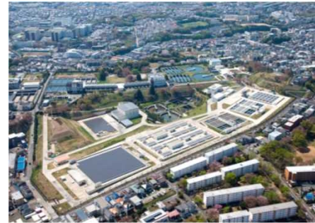
再構築後の長沢浄水場