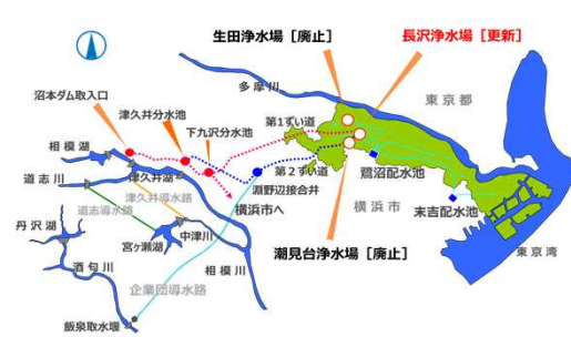
水源と浄水場の位置

この経験を通じて得た多くのノウハウを提供することによって、給水人口や給水量が減少した状況においても、健全かつ安定的な事業運営ができるよう支援いたします。