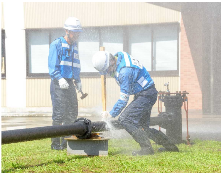
漏水修理デモンストレーション

東日本大震災や熊本地震の応援時には、水道技能スペシャリストを中心に応援隊を編成しており、被災地で状況に応じて迅速に対応することができました。