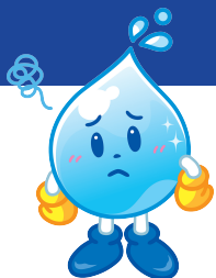
東京都水道局 マスコットキャラクター「水滴くん」