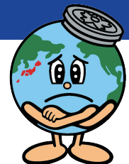
東京都下水道局 マスコットキャラクター 「アースくん」