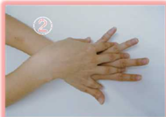
②手の甲をのぼす ようにこする