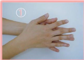
①石鹸を泡立て、 手の平をよくこする