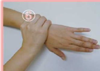
⑥手首も忘れずに洗う