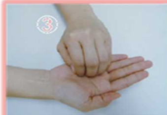
③指先、爪の間を 念入りにこする