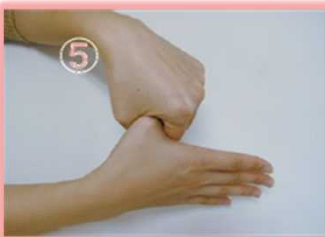
⑤親指と手の平を ねじり洗する