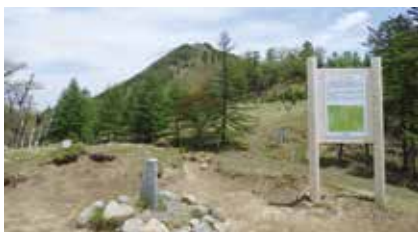
水干ゾーン（源流のみち）