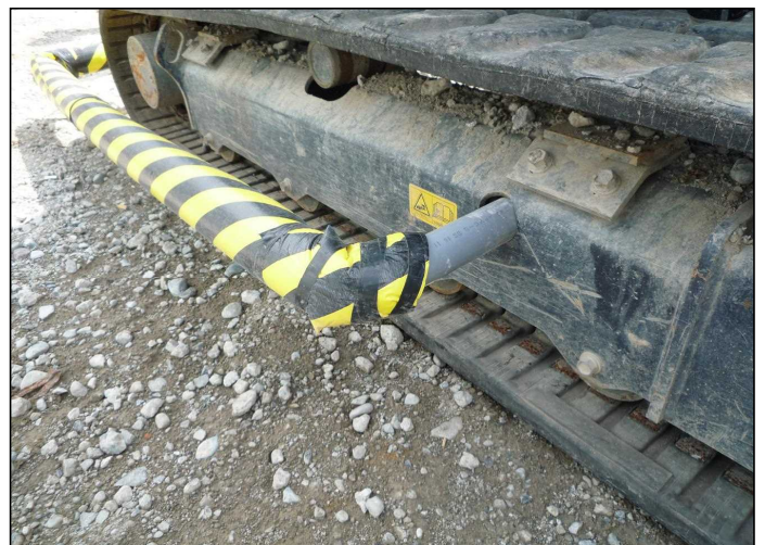
接触防止装置設置2箇所 取付時間20秒