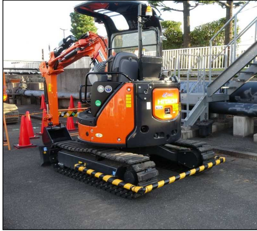
接触防止装置全体