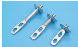
⑥ 座付羽子板100 座付羽子板200