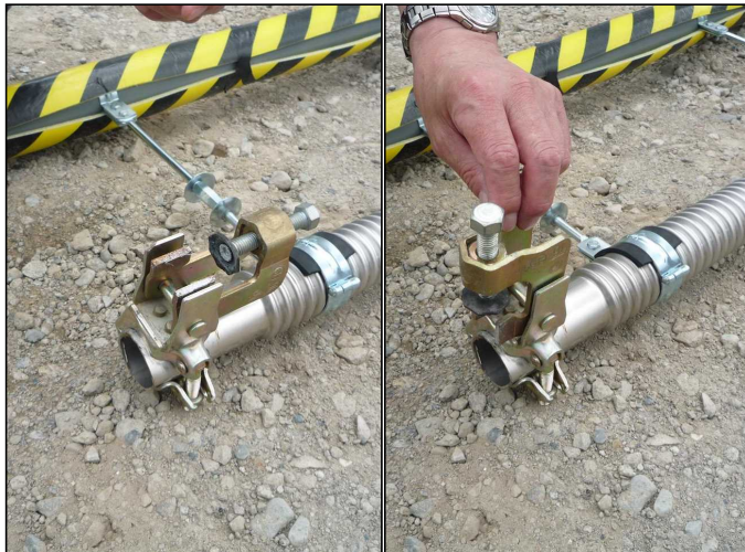
接触防止装置取付クランプ