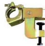
④ホールドクランプ固定