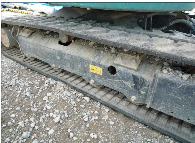
油圧装置注入穴を使用し接触防止装置設置