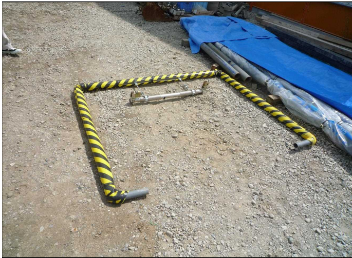
接触防止装置全体