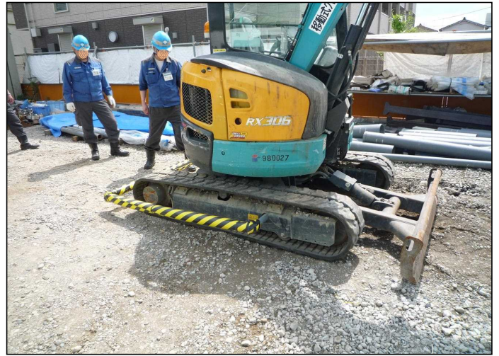
接触防止装置取付状況 全取付時間50秒