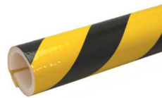
③ 足場単管用トラ養生カバー