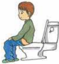
トイレ 1回流すと 約 12 L