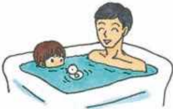
ふろ 約 300 L