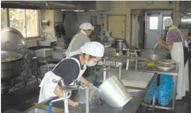
▲学校の給食室 きゅう

わたしたちの周りでは、どんなところで、たくさんの水が使われているでしょうか。学校・地域を回ってさがしてみましょ。