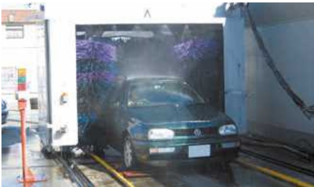
▲ガソリンスタンド