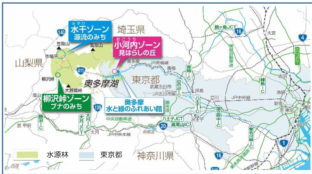
ふれあいのみち位置図