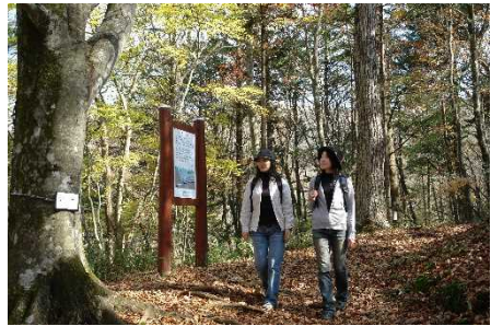
ふれあいのみち(柳沢峠ゾーン)

○ ふれあいのみちの案内板にQRコードを追加し、特設サイトに誘導することで、ふれあいのみちの映像が見られるなど、来訪者がより水源林を楽しんでいただけるようにします。