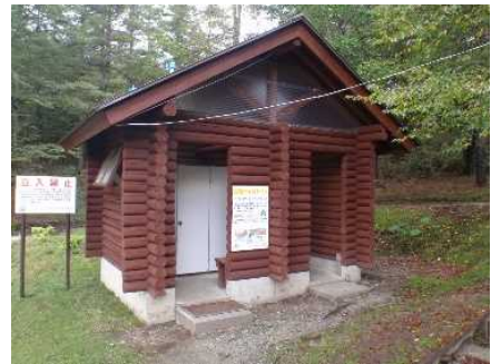
現在のバイオトイレ(笠取小屋)