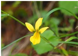
水源林で見られる植物 (キバナノコマノツメ)